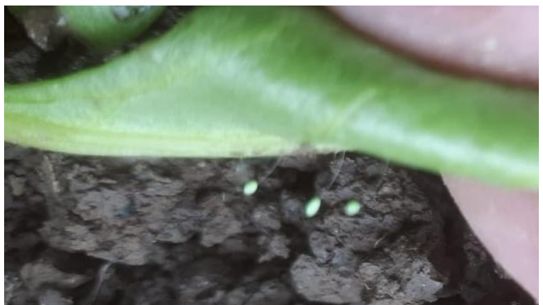
Kuva 3. Poso M.

Torjuntatarve: Ei aiheuta torjuntatarvetta.