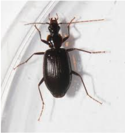
Kuva 1. https://static.inaturalist.org/photos/66859472/medium.jpg

Tuntomerkit: Maakiitäjäiset on kovakuoriaisia, joiden heimo kuuluu petokuoriaisten alalahkoon. Kuoriaisilla on yleensä pitkät ja hoikat raajat. Ne liikkuvat maan pinnalla nopeasti. Väriltään ne ovat useimmin mustia tai metallinkiiltoisia. Suurin osa maakiitäjäisistä on petoja.