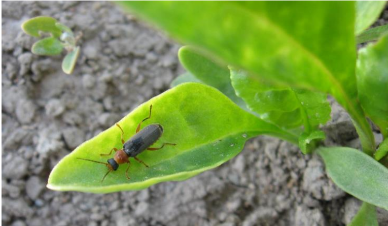
Kuva 1. Kivelä

Tuntomerkit: Sylkikuorisen keskivartalo on oranssi, muuten harmaanmusta.