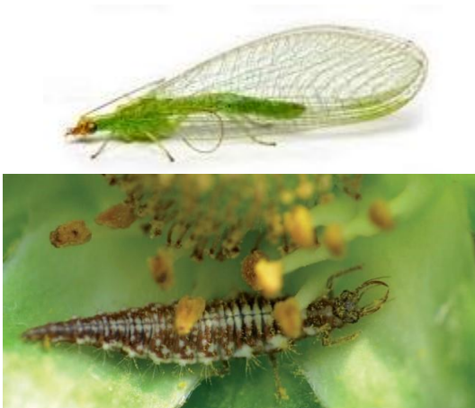
Kuva 1.

Tuntomerkit: Sekä aikuiset että toukat syövät erityisesti kirvoja ravinnokseen. Harsokorennot munivat lähelle kirvaesiintymää ja munat ovat ohuen säikeen päässä.