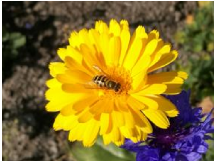
Kuva 2. Sjt

Torjuntatarve: Ei aiheuta torjuntatarvetta.