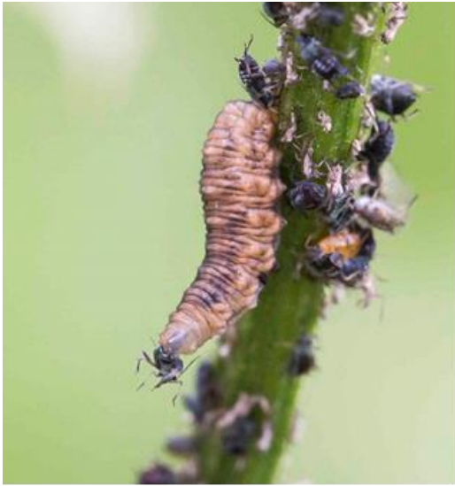
Kuva 1. https://www.otokkatieto.fi/uploads/fullscreen/kukkakarpanentoukka.jpg

Tuntomerkit: Aikuiset kukkakärpäset ovat pölyttäjiä ja kukkakärpäsen toukat käyttävät ravintonaan tuholaisten toukkia ja kirvoja.